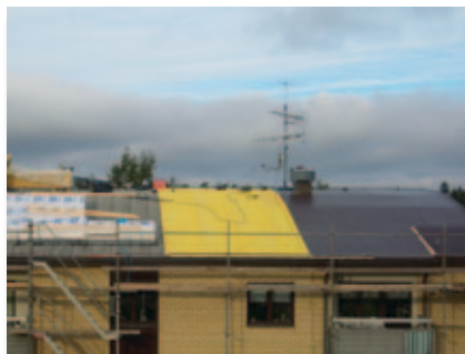
Cellplast jämnar ut mellan falsarna och obrännbar mineralullsboard läggs ut som migreringsspärr mot takduken.