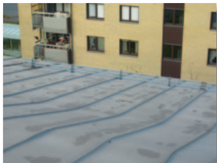
Gammalt plåttak med rost och flagande färg.

Har Du ett bandtäckt tak som behöver blästring och målning. Och hur länge håller det sedan? En omläggning med takduk kostar inte så mycket mer och kan utföras nästan väderoberoende. På köpet får Du 10 års materialgaranti och ca 30 års livslängd.