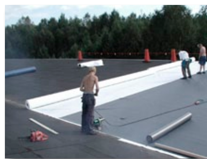
Ikea, Älmhult - Omtäckning av uttjänt papptak med takduk och polyesterfilt som migrerings-spärr.

Våra medlemsföretag har auktoriserade takentreprenörer över hela landet. Ta kontakt med